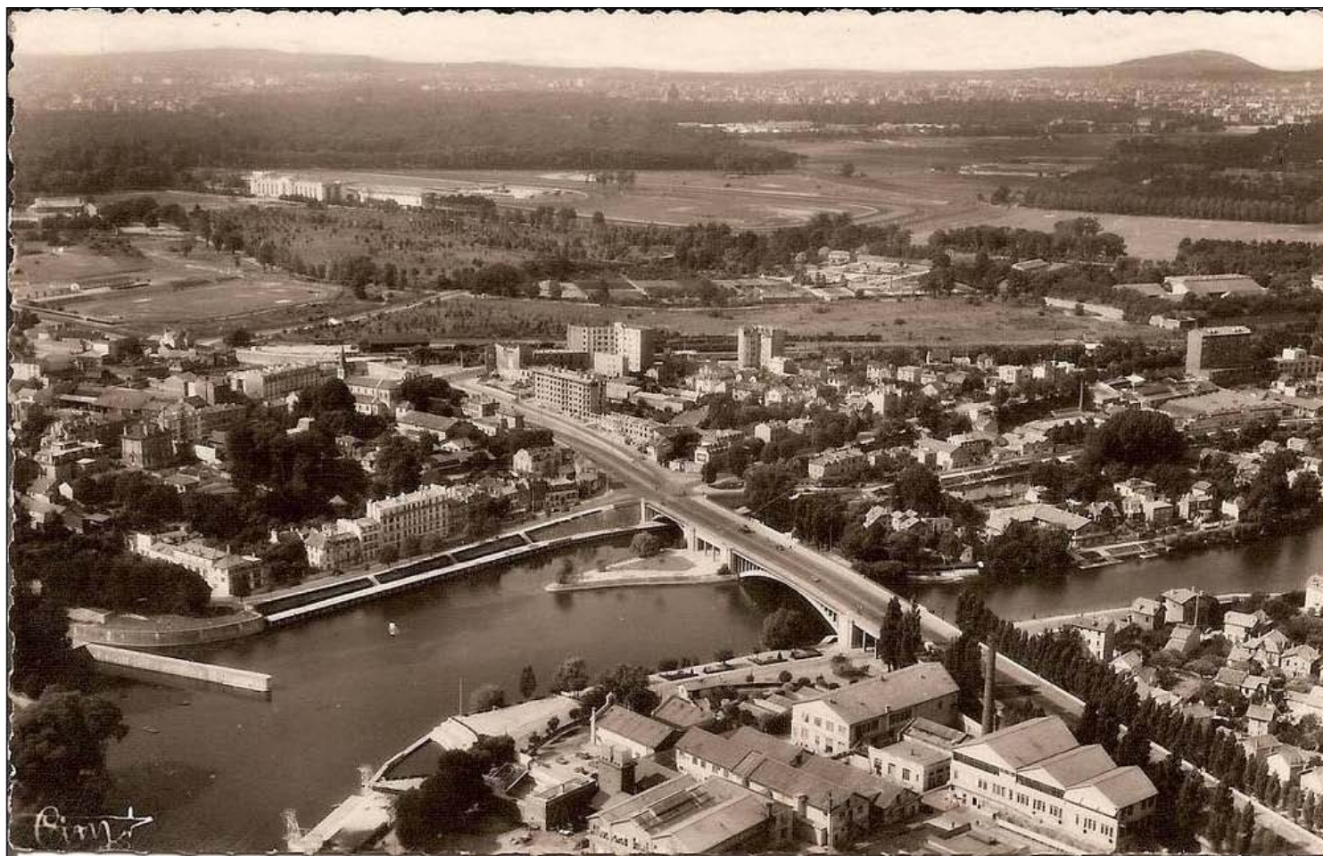
On reconnaît les laboratoires de cinéma au premier plan, et tout autour le dentelé qui signe son époque : début 60 ?