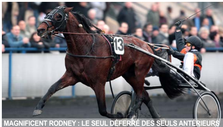
MAGNIFICENT RODNEY : LE SEUL DÉFERRÉ DES SEULS ANTÉRIEURS

Petite particularité démontrant l'impact toujours grandissant du déferrage dans le résultat des courses au trot, l'édition 2009 du Prix d'Amérique est la première de l'histoire à voir tous les partants de la course ayant émis une intention de déferer. Hormis Return Money (postérieurs), Magnificent Rodney (antérieurs) et Qualita Bourbon (postérieurs), tous les autres concurrents ont été déclarés pieds nus.